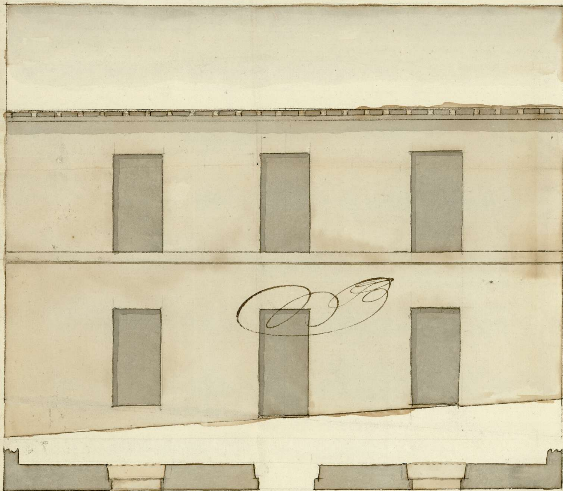
51-A. Fachada por la C. del Ave Maria