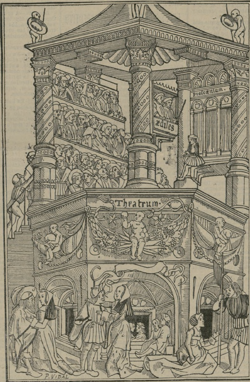
El teatro de Terencio.

A causa de su solidez es propia para trabajos de ornamentación y para bocetos y modelos, siendo apta para cualquier trabajo que permita otra pasta de madera».