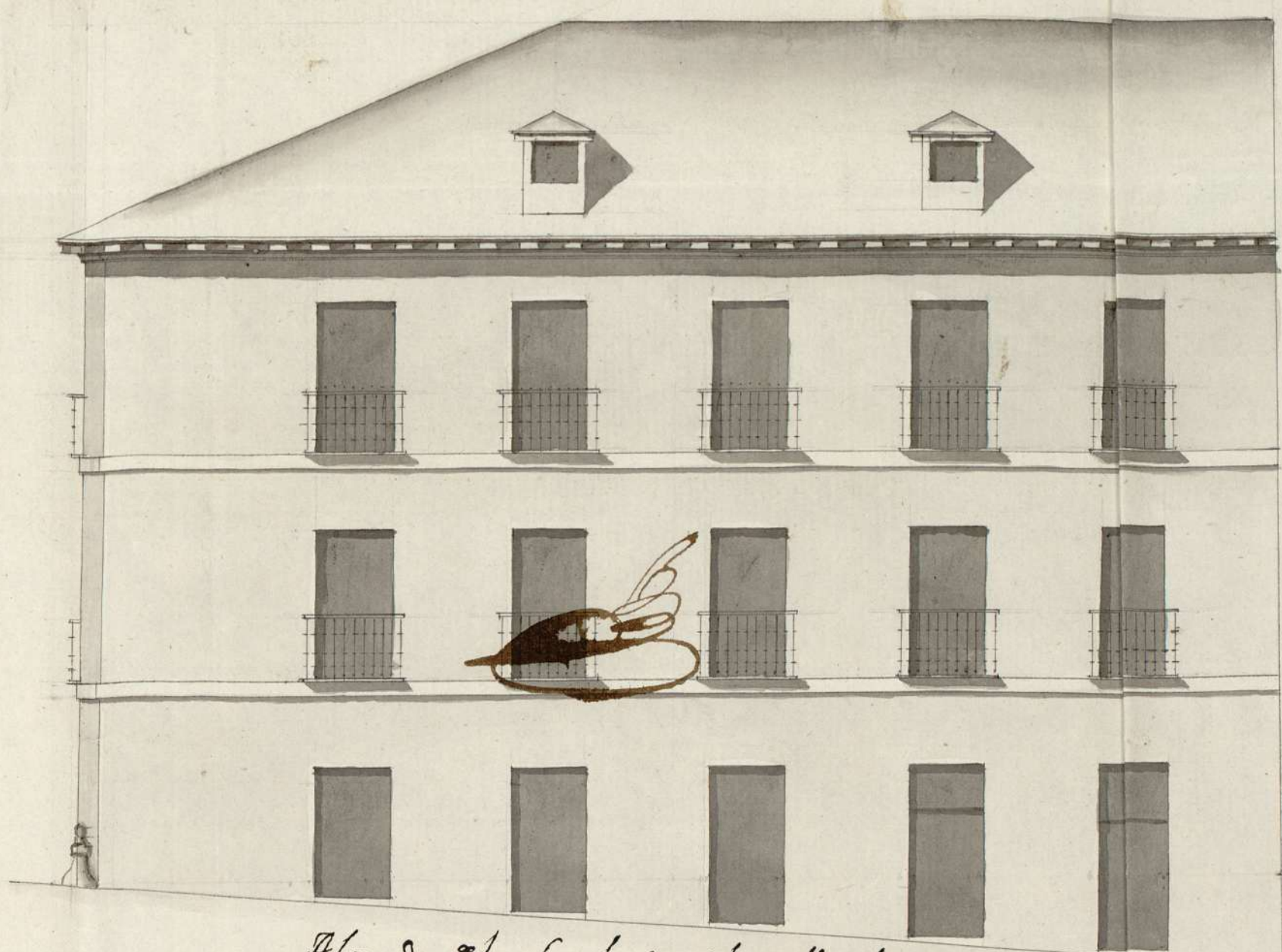
Alzado de la fachada de la calle de las minas.