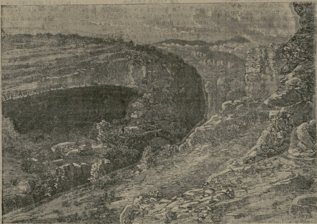
Gargantas del Tirol.

Adán, más fuerte para el dolor, mudo y sombrío, observaba, según iba caminando, cómo el cielo que él siempre viera limpio y brillante, se oscurecía... El sol se ocultó de pronto, aquel sol hermoso jamás empañado, generador de la luz pura, destiladora antorcha del espacio infinito... Fulguró un relámpago, retumbó el trueno... Así Jehová mostró su ira a los expulsados.