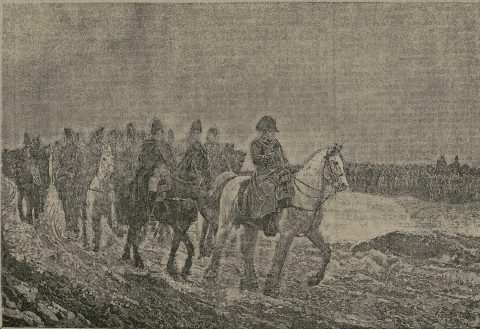
«1814,, (Campaña de Francia).

¡Y qué lienzo! en el amplio y espléndido