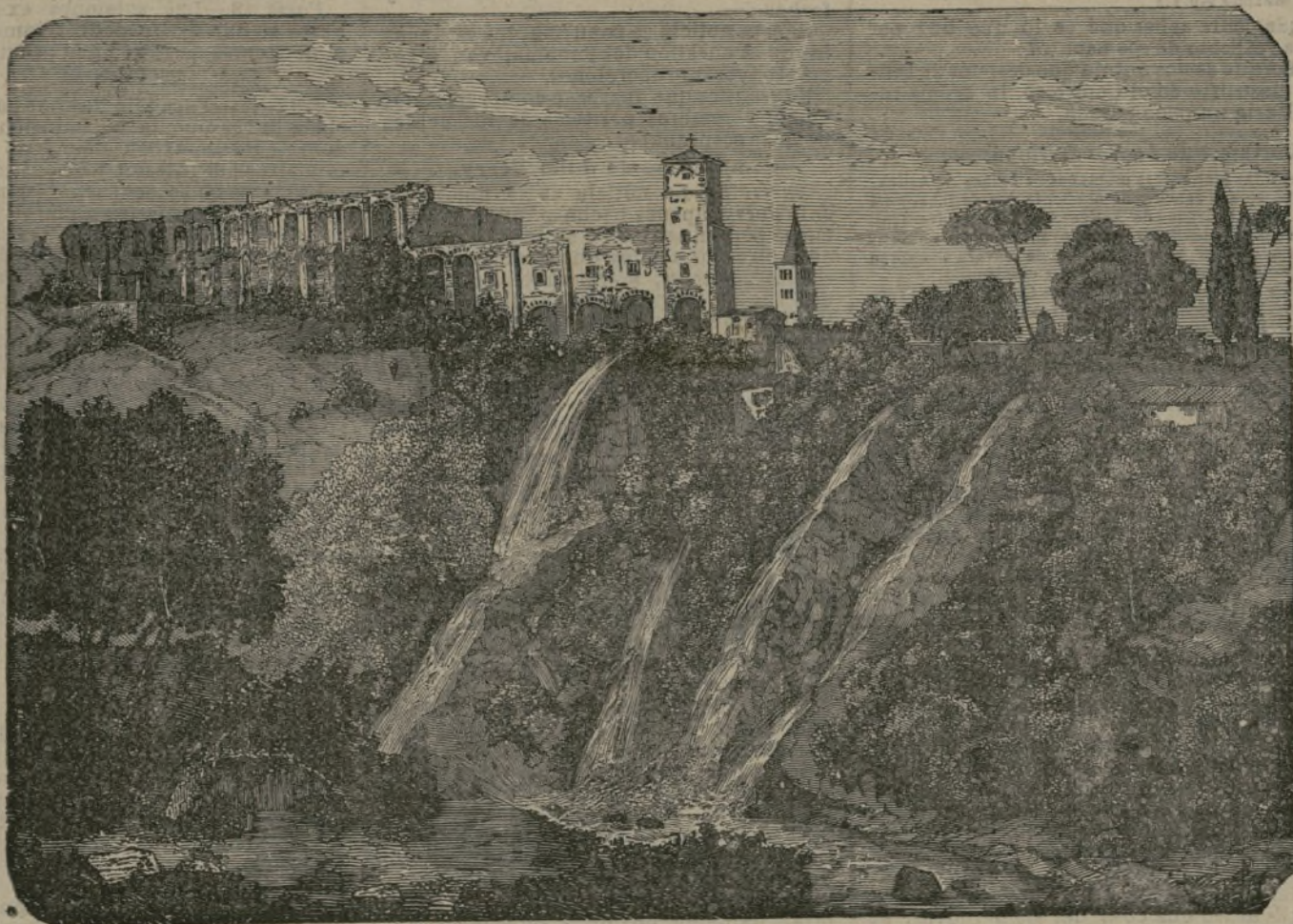
Cascadas de Tivoli.

Libro histórico. El mayor volumen encuadernado que hay en el mundo lo posee la reina Victoria de Inglaterra. Pesa 63 libras y tiene pie y medio de espesor. Contiene las felicitaciones dirigidas a S. M. B. con ocasión del quincuagésimo jubileo de su reinado, y le fué remitido el 20 de Junio de 1887.