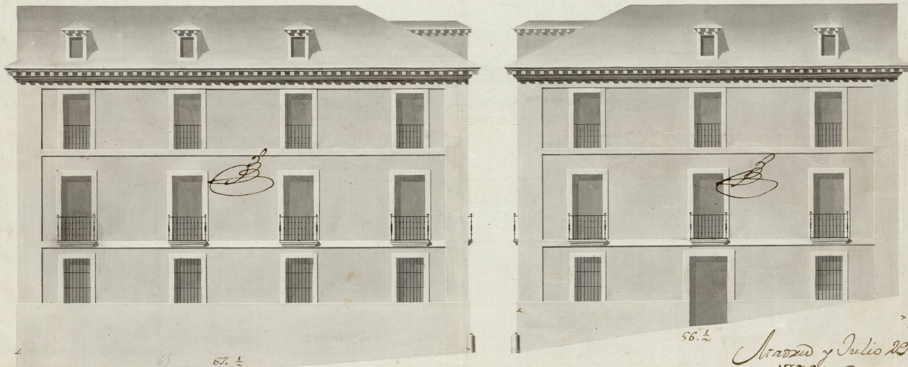
Elevacion dela Fachada, ala de Bastero.

Impreso en Madrid en el 10 de Diciembre de 1795 Manrique