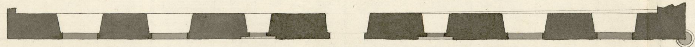
fachada calle de la Berengena.