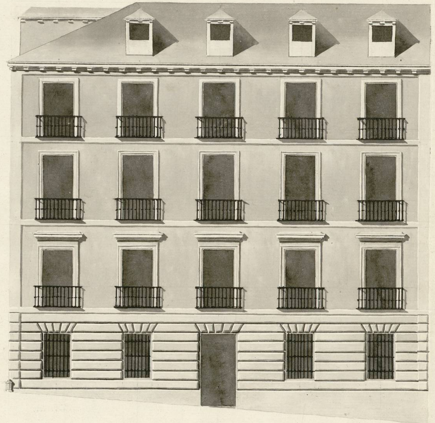
Fachada á la Plaza de la Alcantarilla de Leganitos.

Informado á Madrid en 5 de Julio de 1795 Villacrescen