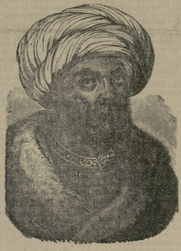
Ibrahim, sultan de Turquía.