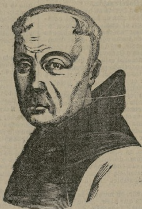
Fray Giovanni Giocondo.