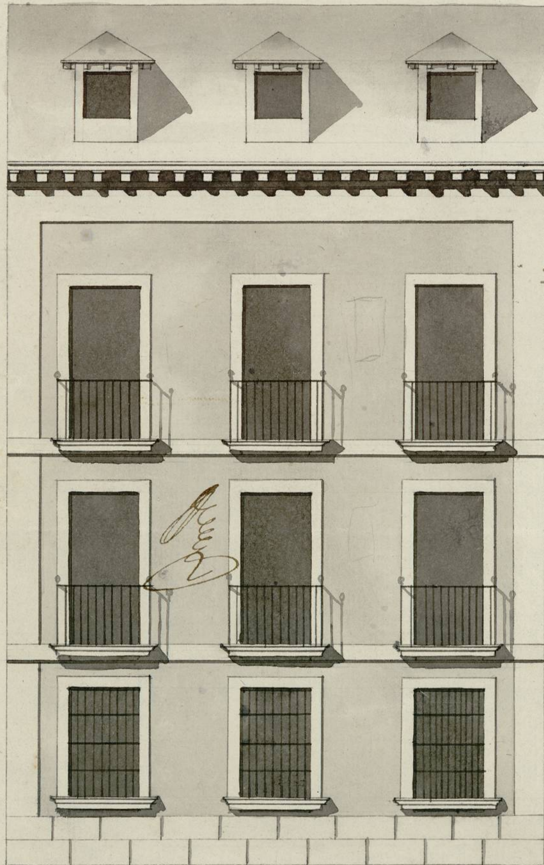
Fachada de la Calle de los Preciados.