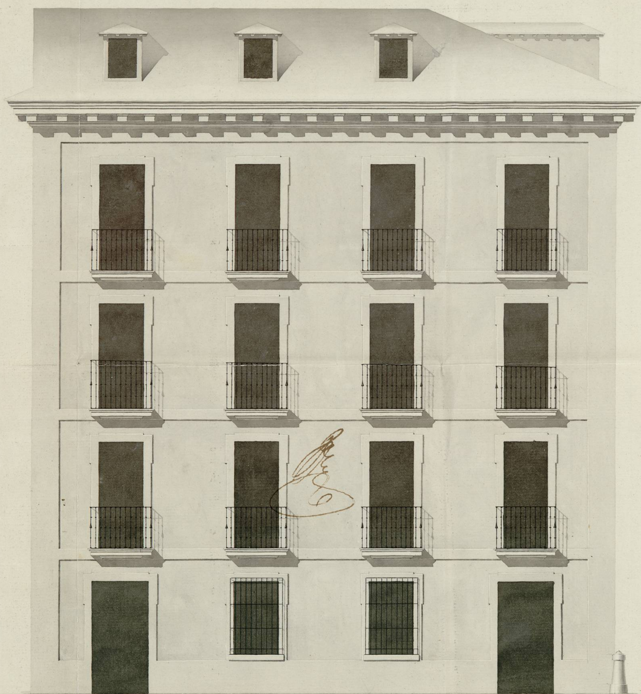
Fachada a la Calle de Leon.