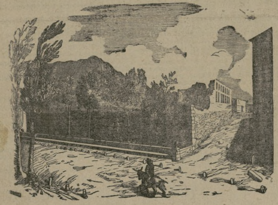
Ruinas en Terracina.