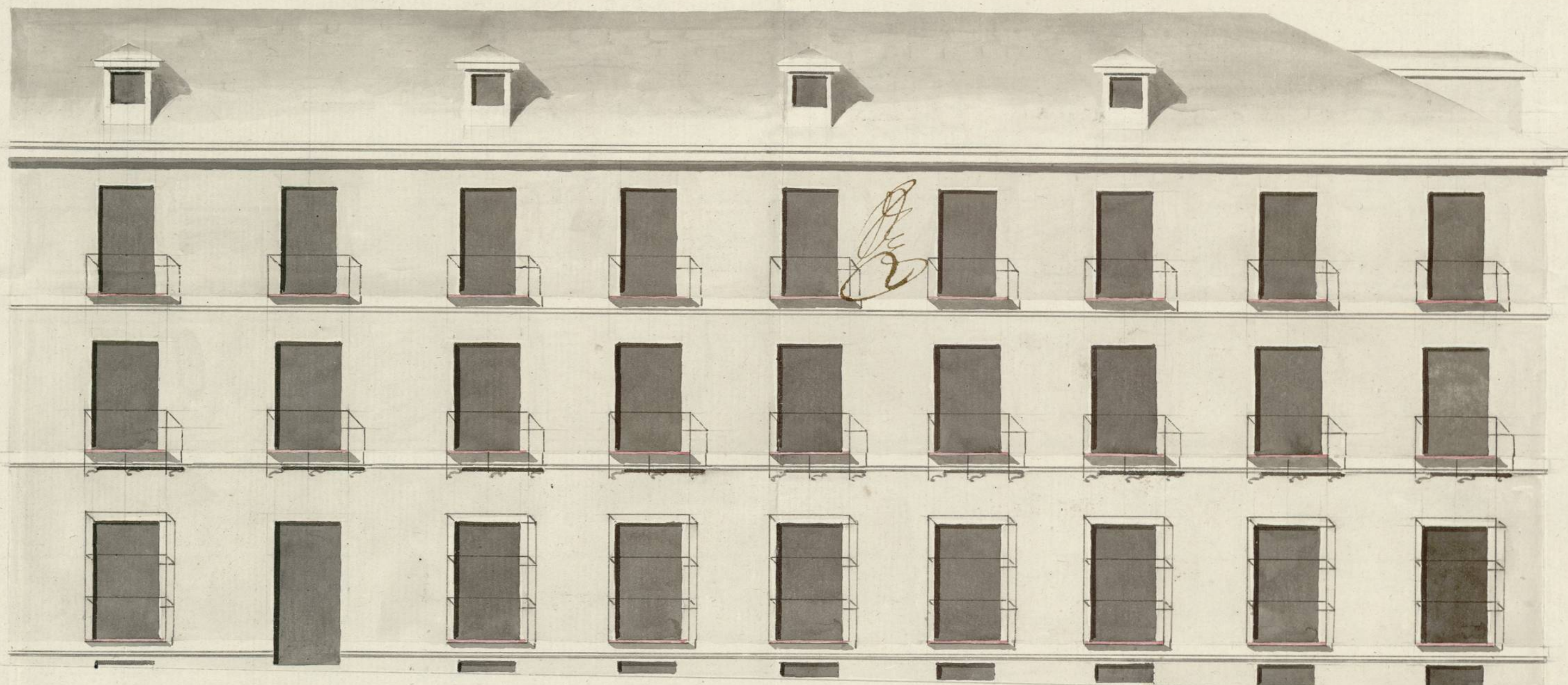
Fachada a la Calle de S. n Martín.