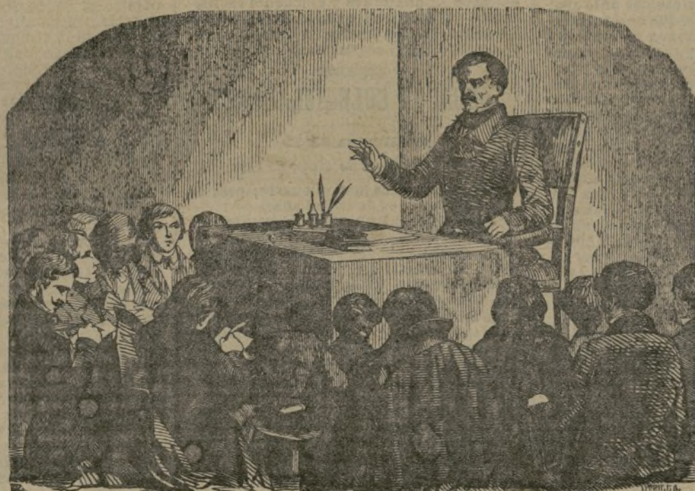
En el Liceo de Cassel.

garon á ser para el originario pueblo egipcio, venerados seres y sagrados personajes, por los que se dejó gobernar durante muchos siglos, realizando de esta suerte el reino de los filósofos y el ideal de las futuras democracias, para venir á convertirse mucho más tarde, allá en los albores de la historia del Egipto, en las monarquías militares, de todos los eruditos conocidos (5).