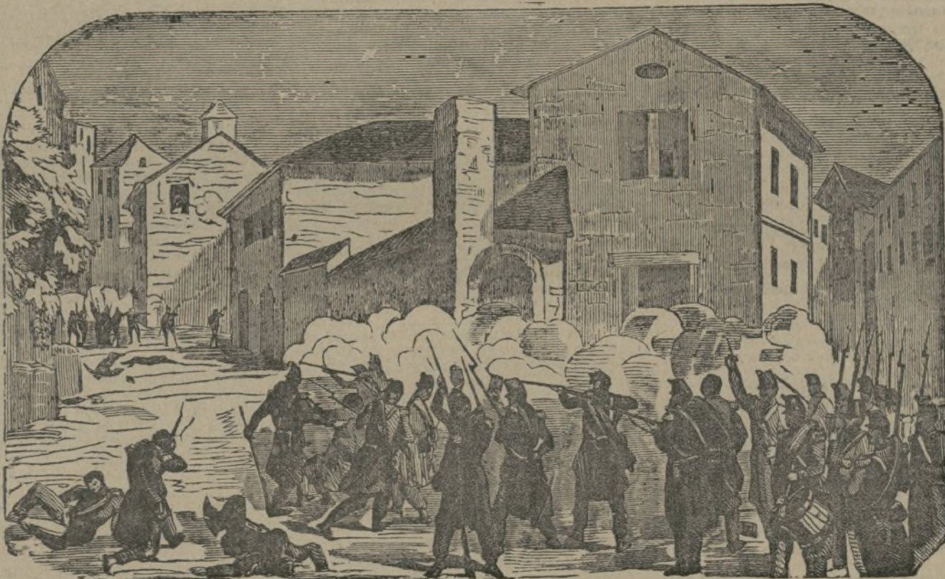
Episodios de la guerra.

Administración, Puerta del Sol, 13. Madrid.