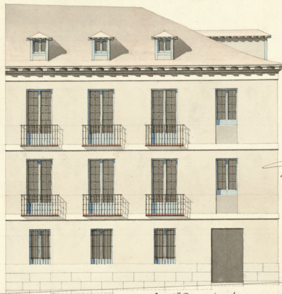
Fachada ala C. de S. ta Bartolomé