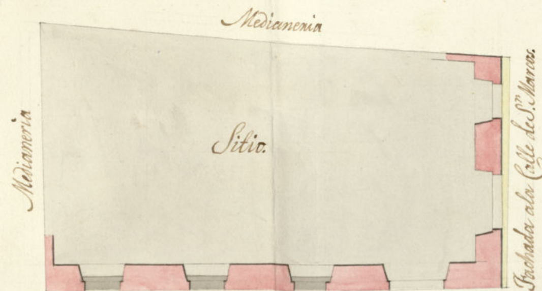
Fachada ala C. de S. ta Bartolomé