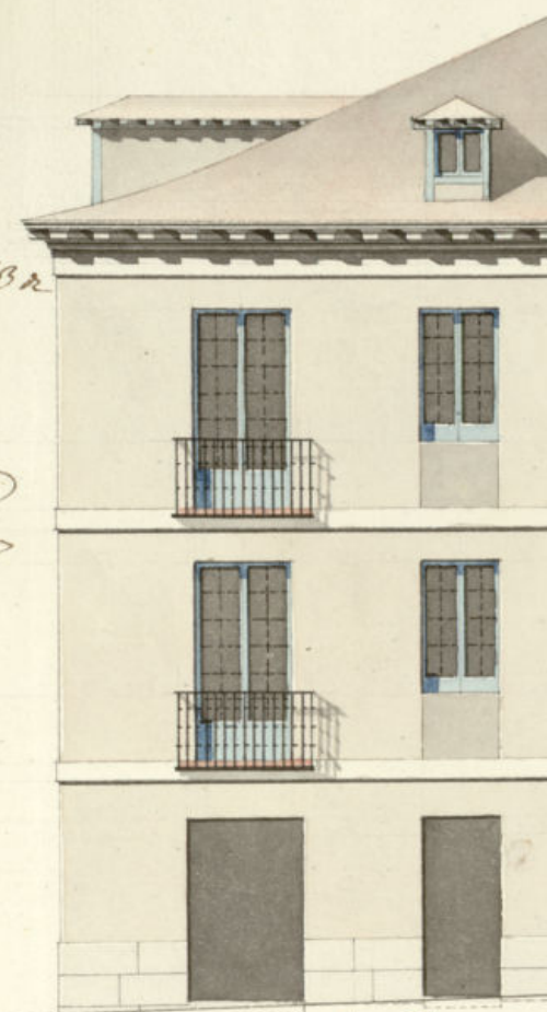
Fachada ala C. de S. ta Marcos.