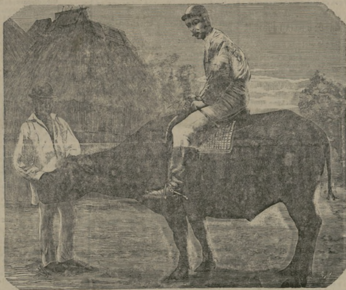
Carreras de búfalos.