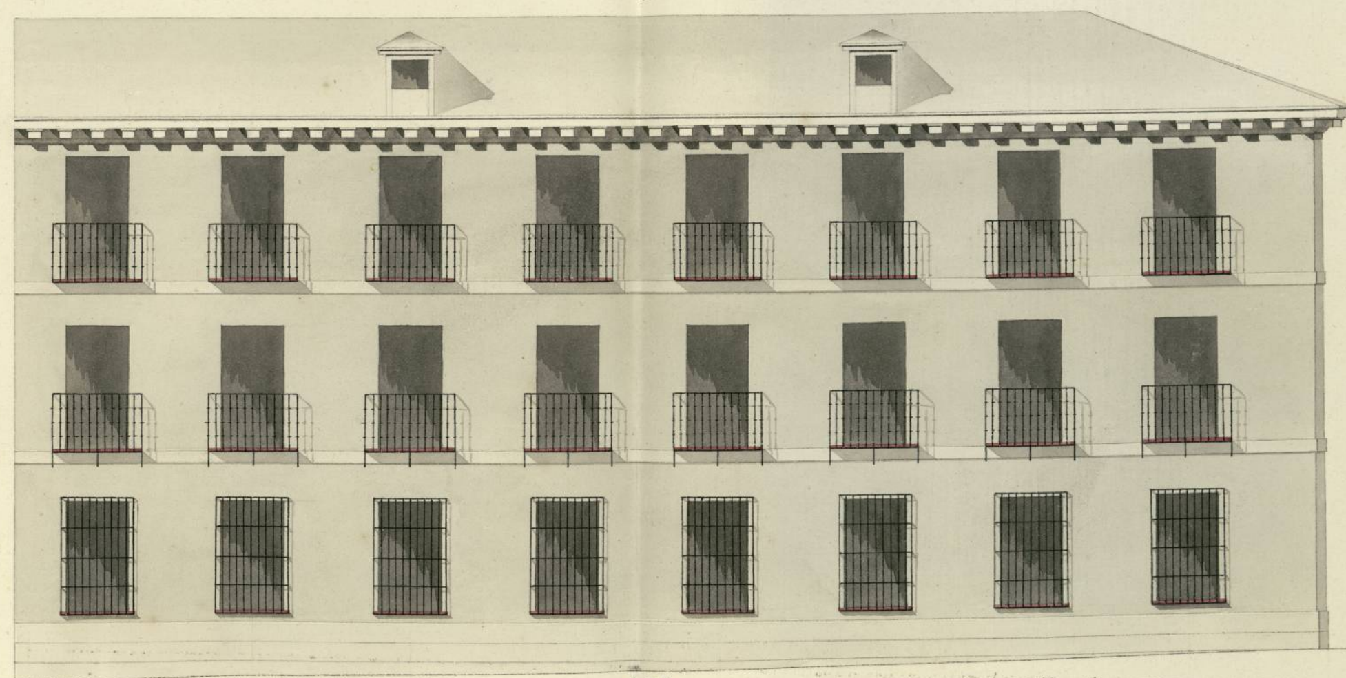
Fachada de la Casa Calle de las Aguas 11. a 12. 13. y 14. manz. a 116.

Uniformado en 22 de Mayo de 1816. Viguado