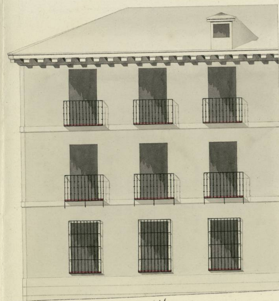
Calle de las Tabernillas.