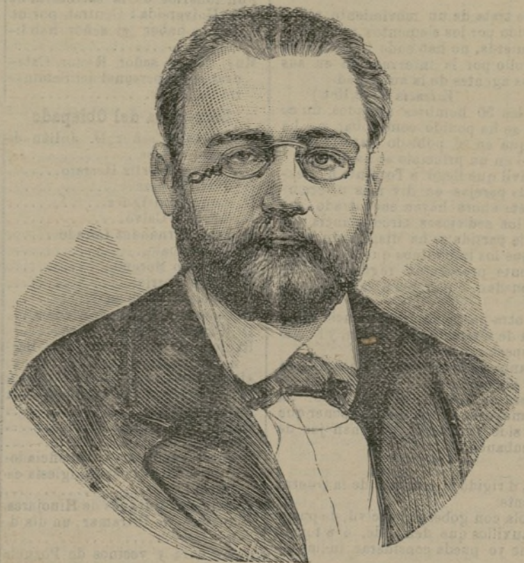
MR. EMILE ZOLA

Esto no ejercerá influencia en los precios actuales de los alcoholes, pero podrá hacer disminuir la importación de vinos extranjeros, y principalmente españoles.— Fabra .