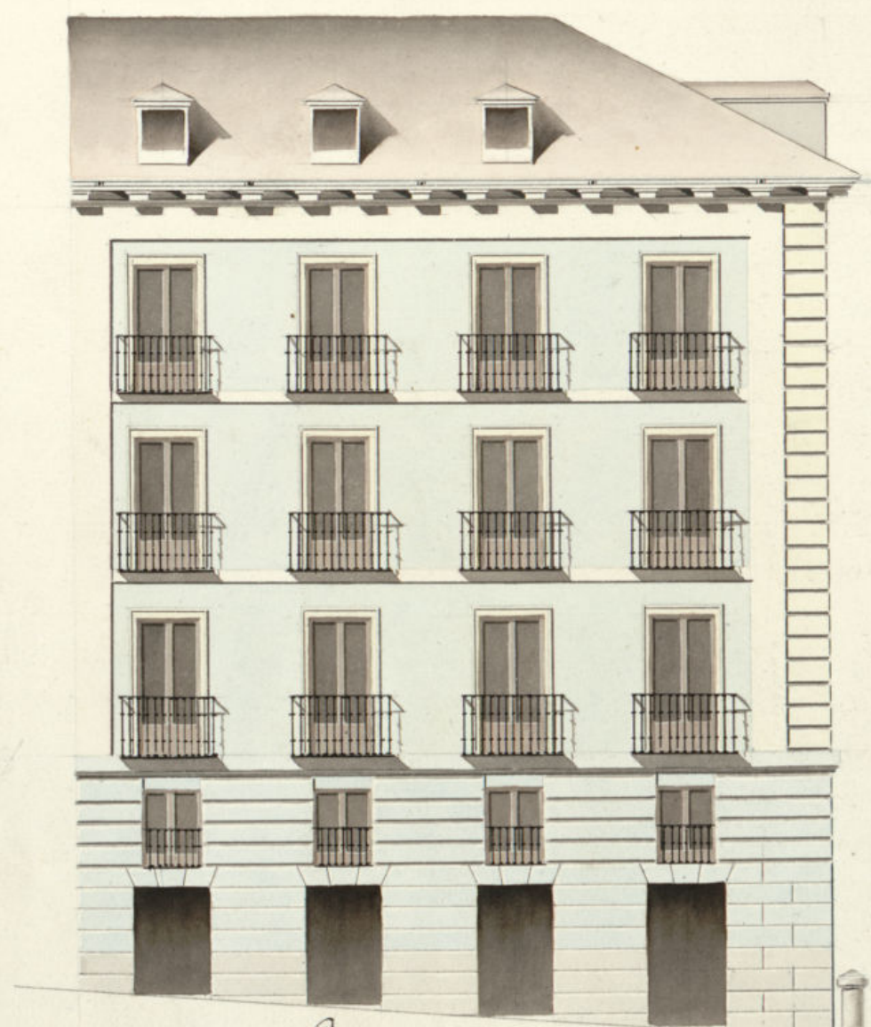
Calle de Calatrava