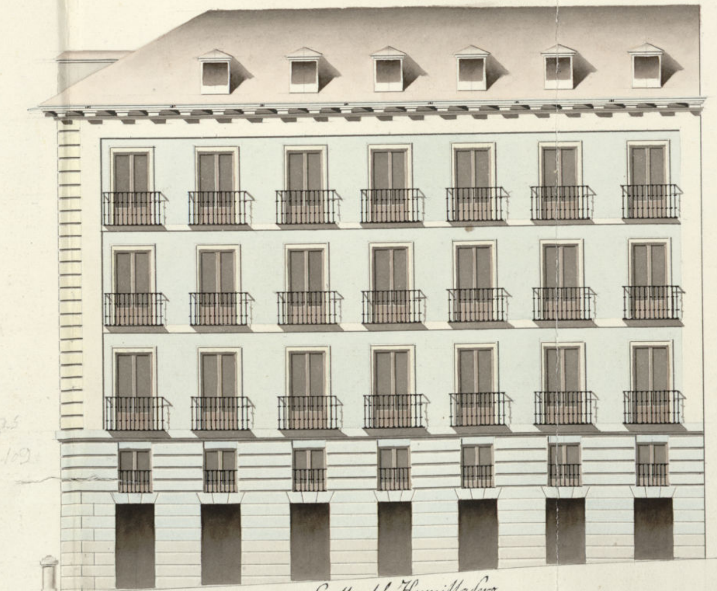
Calle del Humilladero

Pies 10. 5. 0. 10. 20. 30. 40. 50. 60. 70. 80. 90. Cast