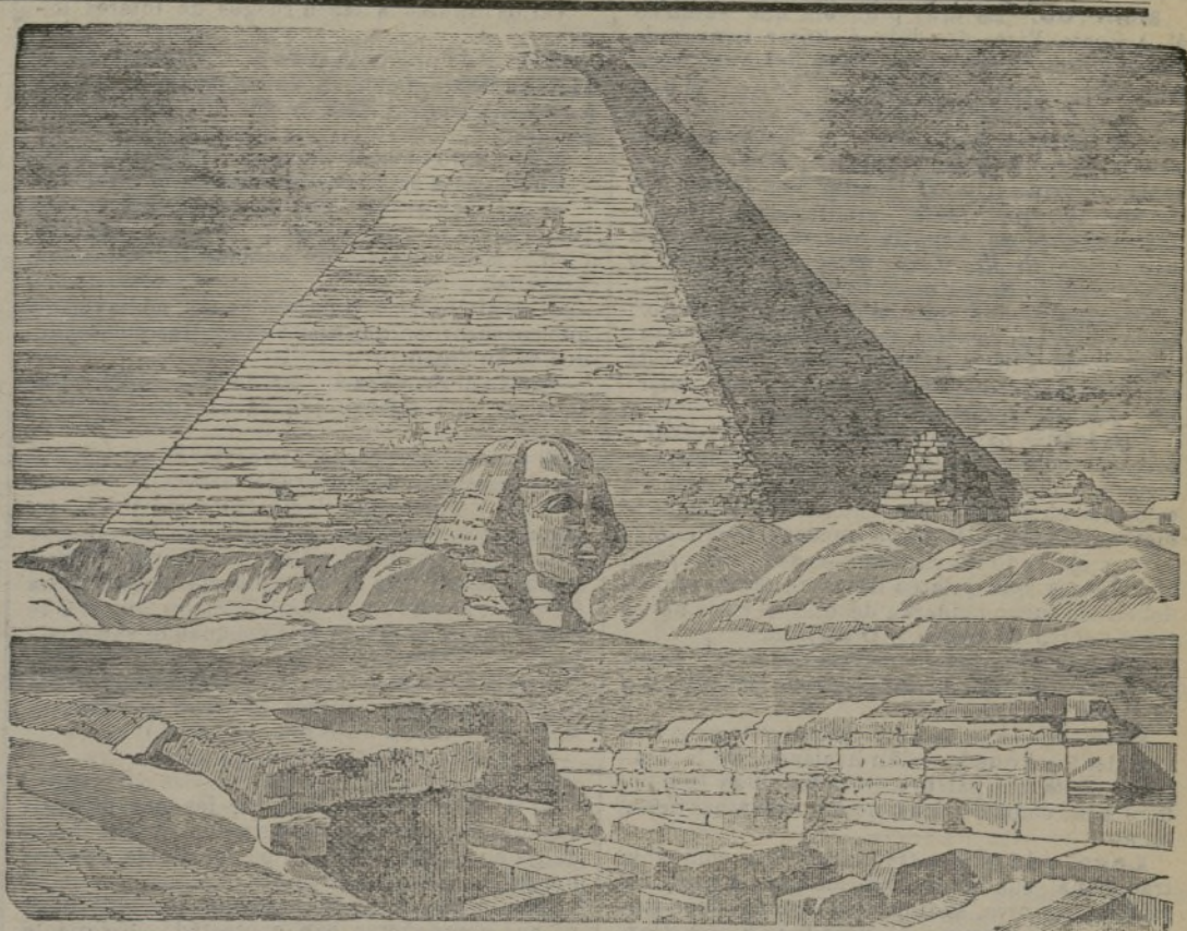
LAS PIRÁMIDES DE EGIPTO