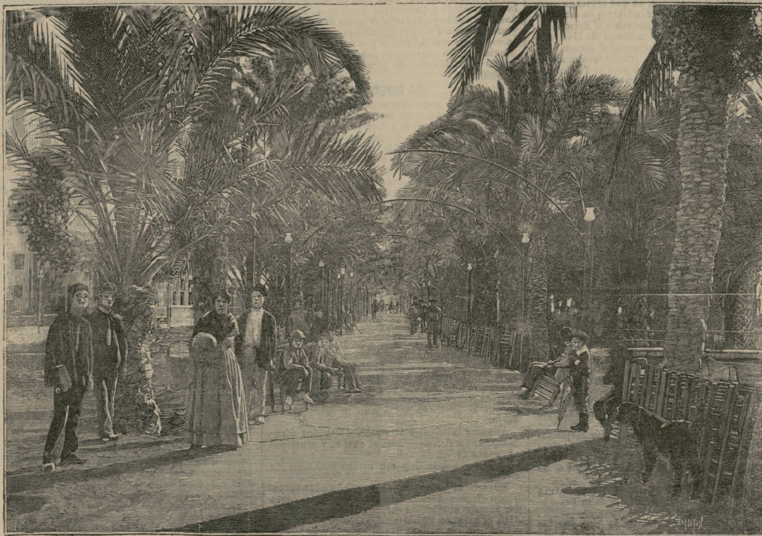
Paseo de los Mártires (Alicante)

Y tomada que fué en consideración una pro-