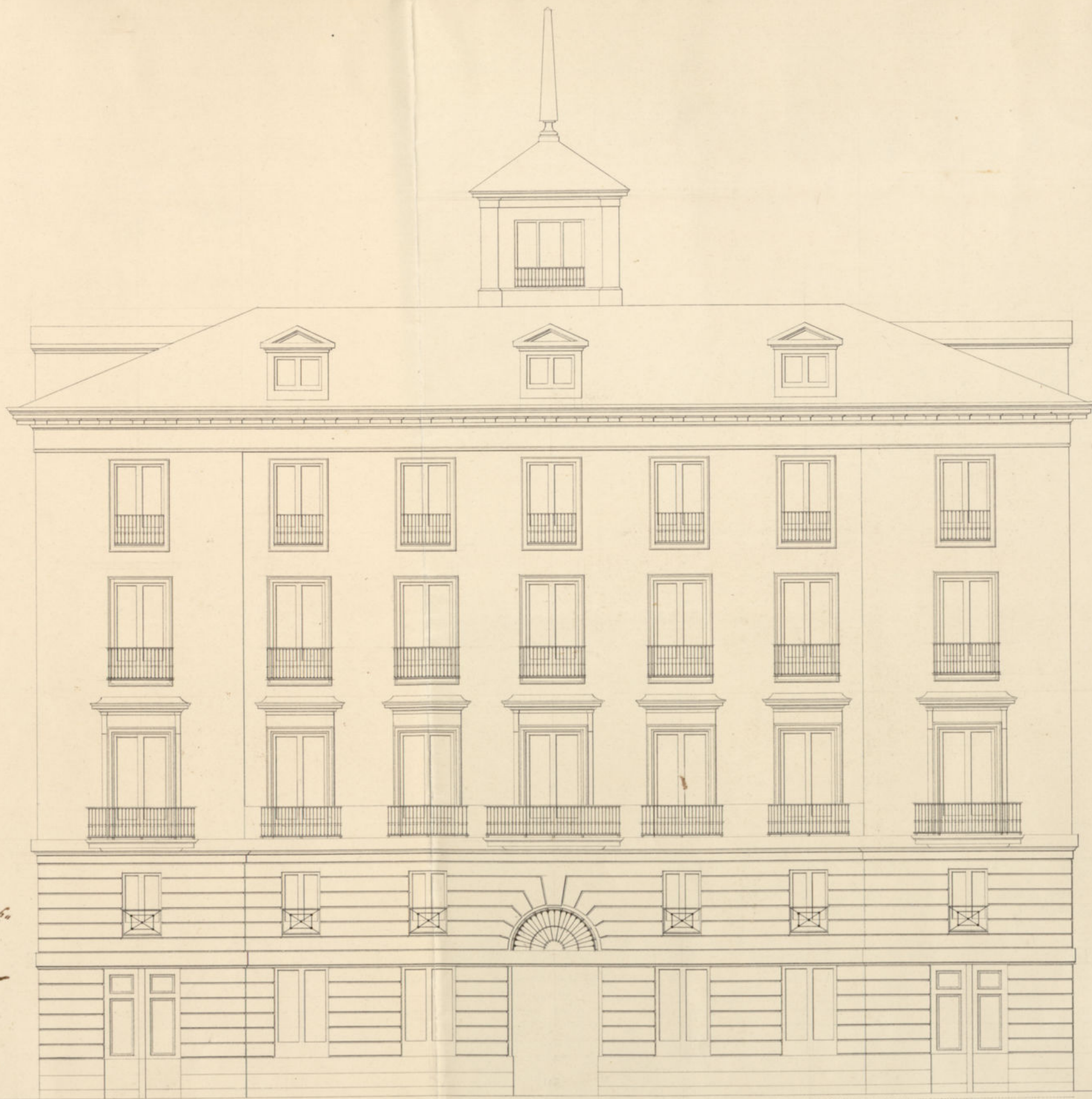
Fachada principal de una casa de nueva planta que se ha de construir en la calle de Alcalá manzana 277.ª propia del Excmo. Sr. Marqués de Casa-Irujo