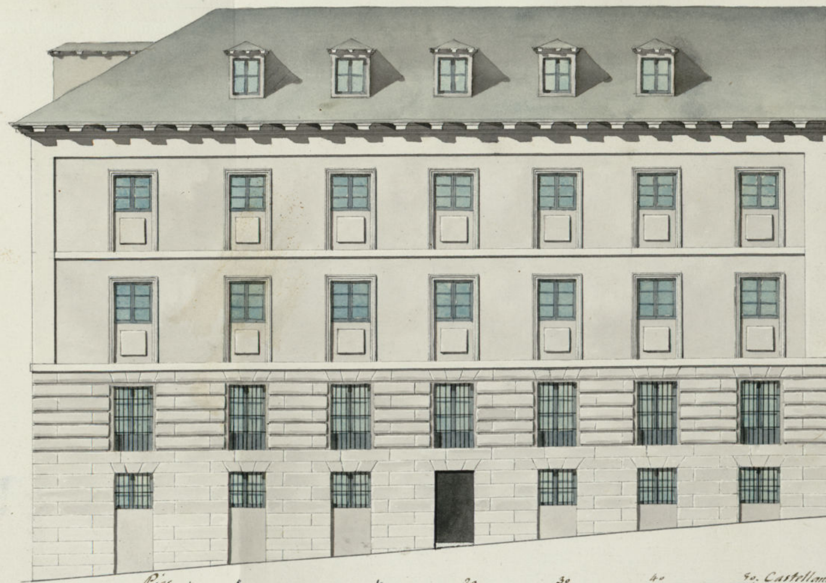
Calle de la Parada.