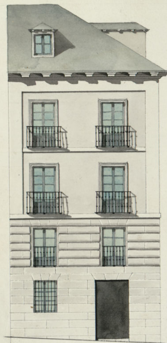
Calle de las Beatas.