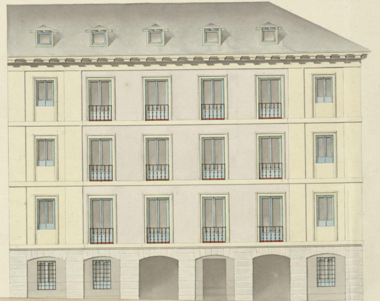
Fachada a la Calle del Lazo