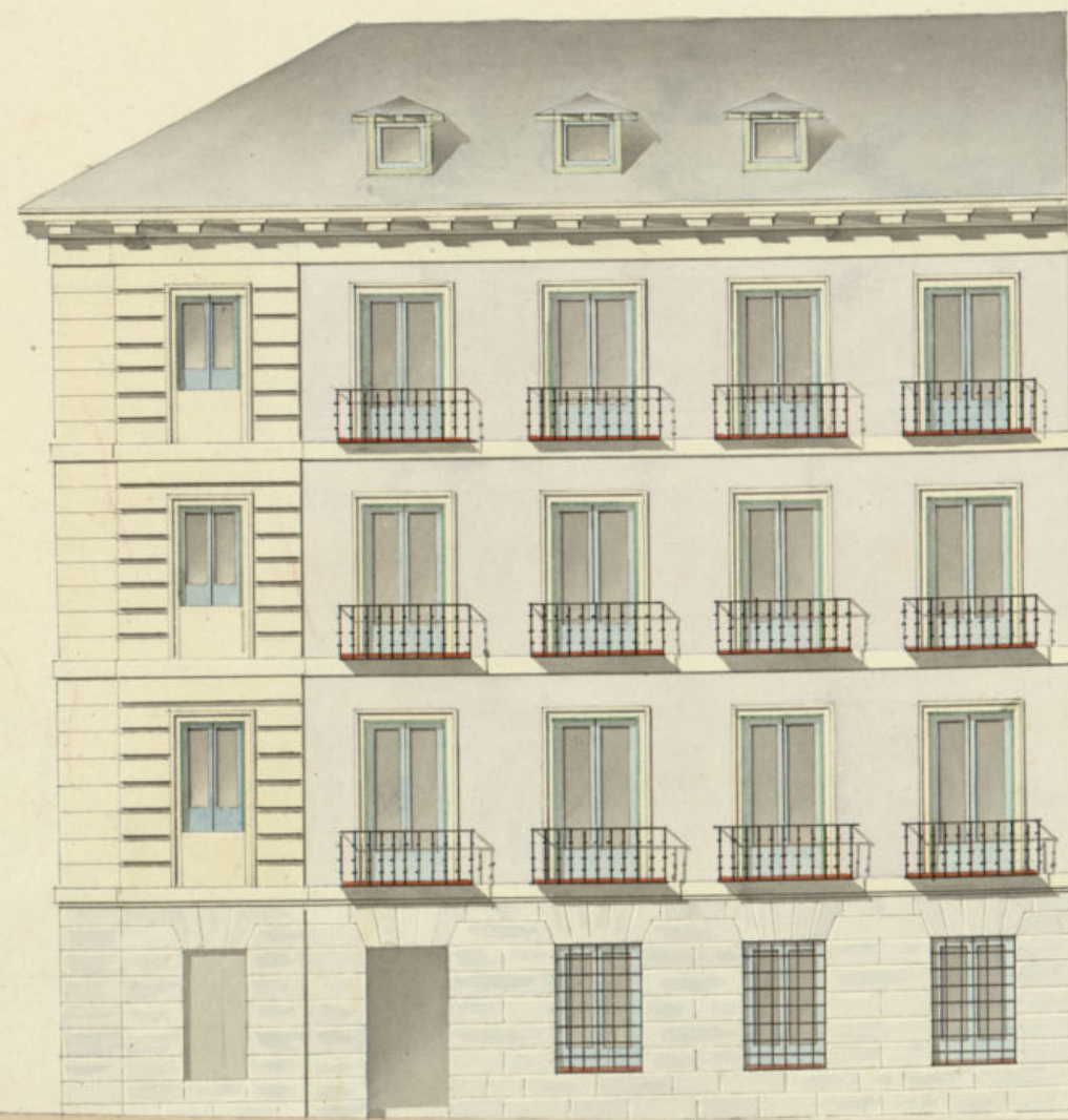
Fachada a la Calle del Espigo