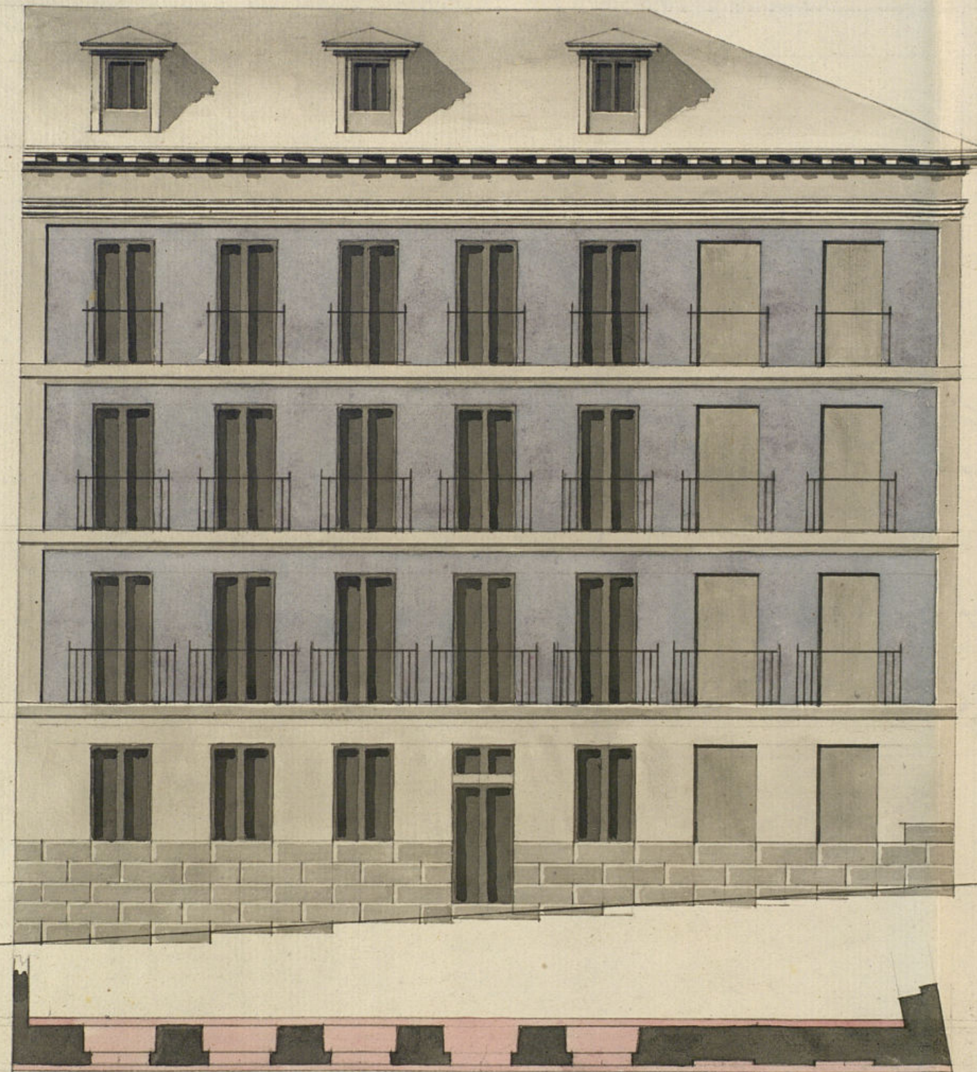
Fachada a la Calle ancha de S ta Clara.

Informado en 3 de Junio de 1835 Navisera