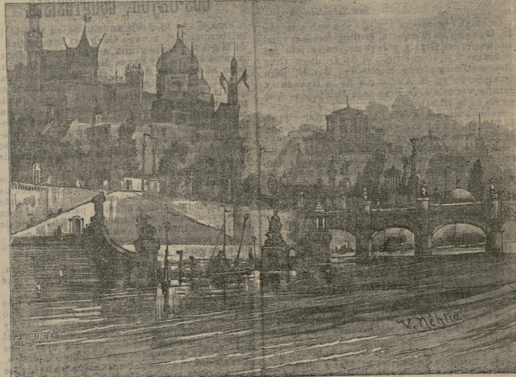
PARIS, DENTRO DE MIL AÑOS