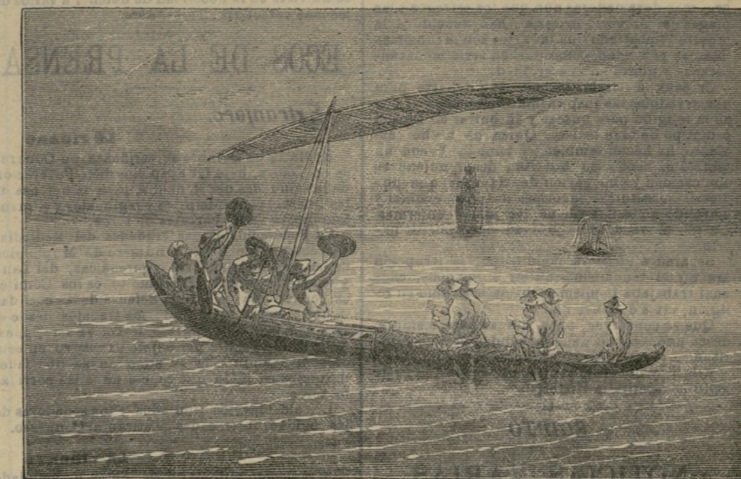
Un koro-koro malayo en el mar de las Molucas.

Estos recursos extraordinarios no atajan el mal, y volvemos a repetir que urge estudie el Gobierno el medio de resolver un problema que requiere tiempo y meditación por la importancia que para el vecindario tiene.