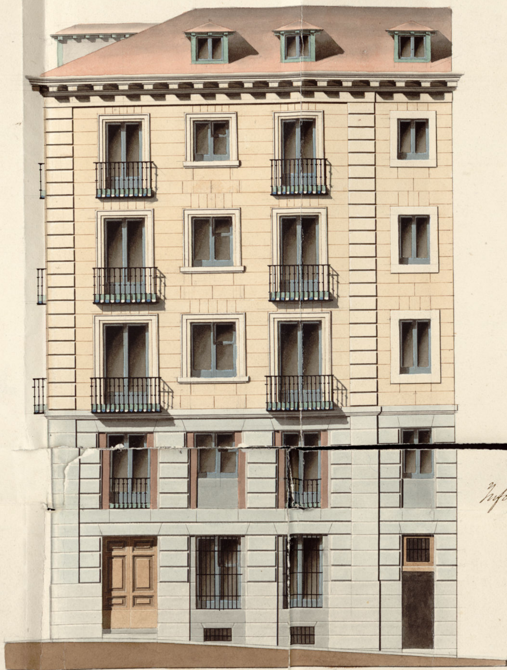
Calle de los Negros numero 28.