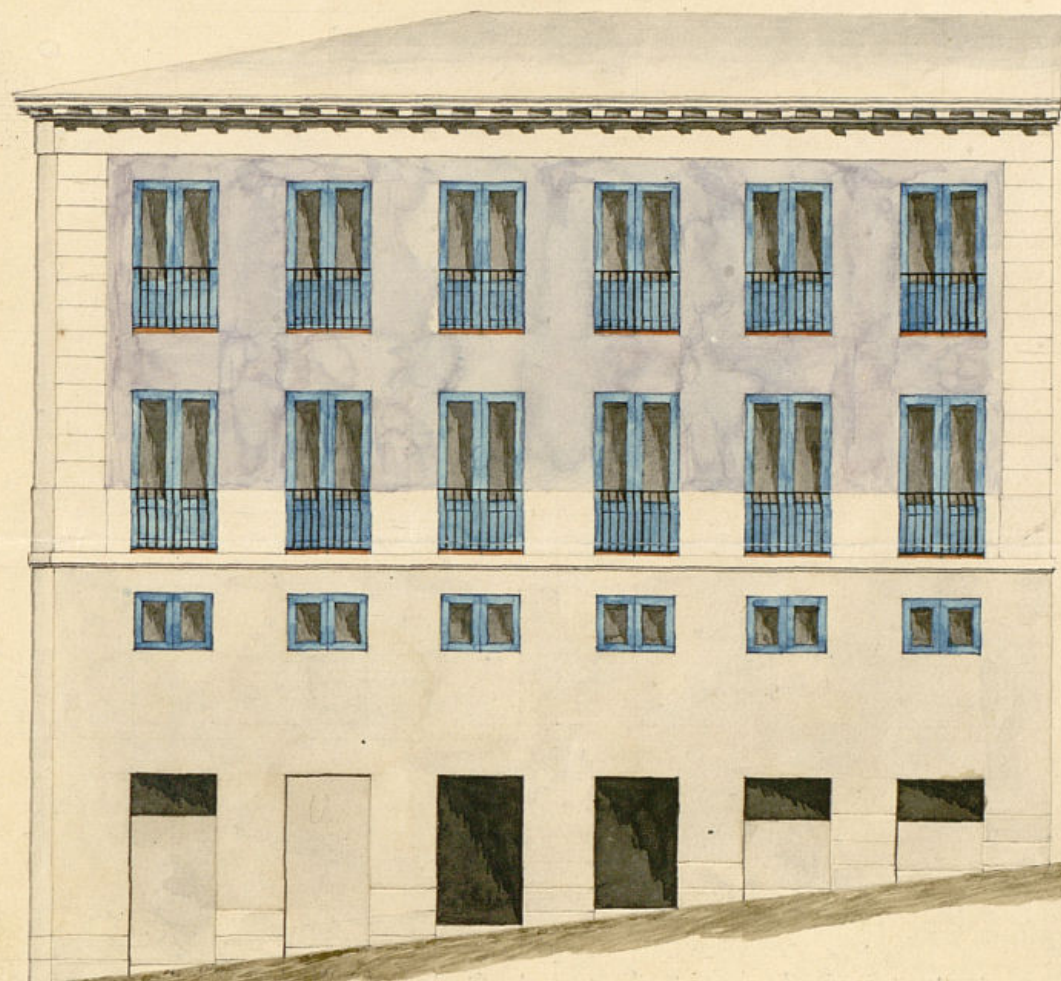
Fachada por la calle del Corro.