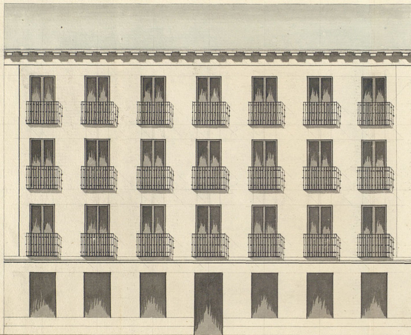
Fachada de la Calle de la Estrella

Fachadas de la casa sita en esta Corte y su calle de la Estrella con accesorias à la de la Cueva, señalada con el N.º 7, por la primera y 4, por la segunda, Manz.ª 468.