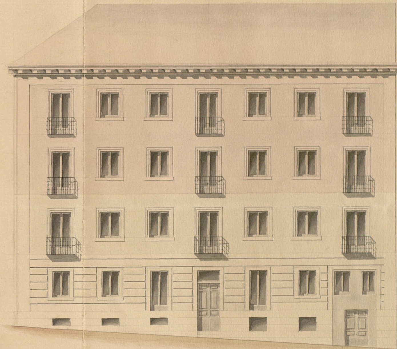
Calle del Gobernador N.º 1 nuevo.

Escala de 1º 5 9 1º 2º 3º 4º 5º 6º 7º 8º 9º Pies Castellanos