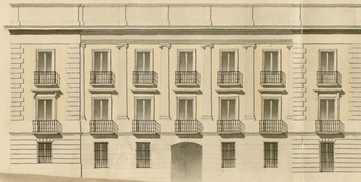
Calle de las Torres.