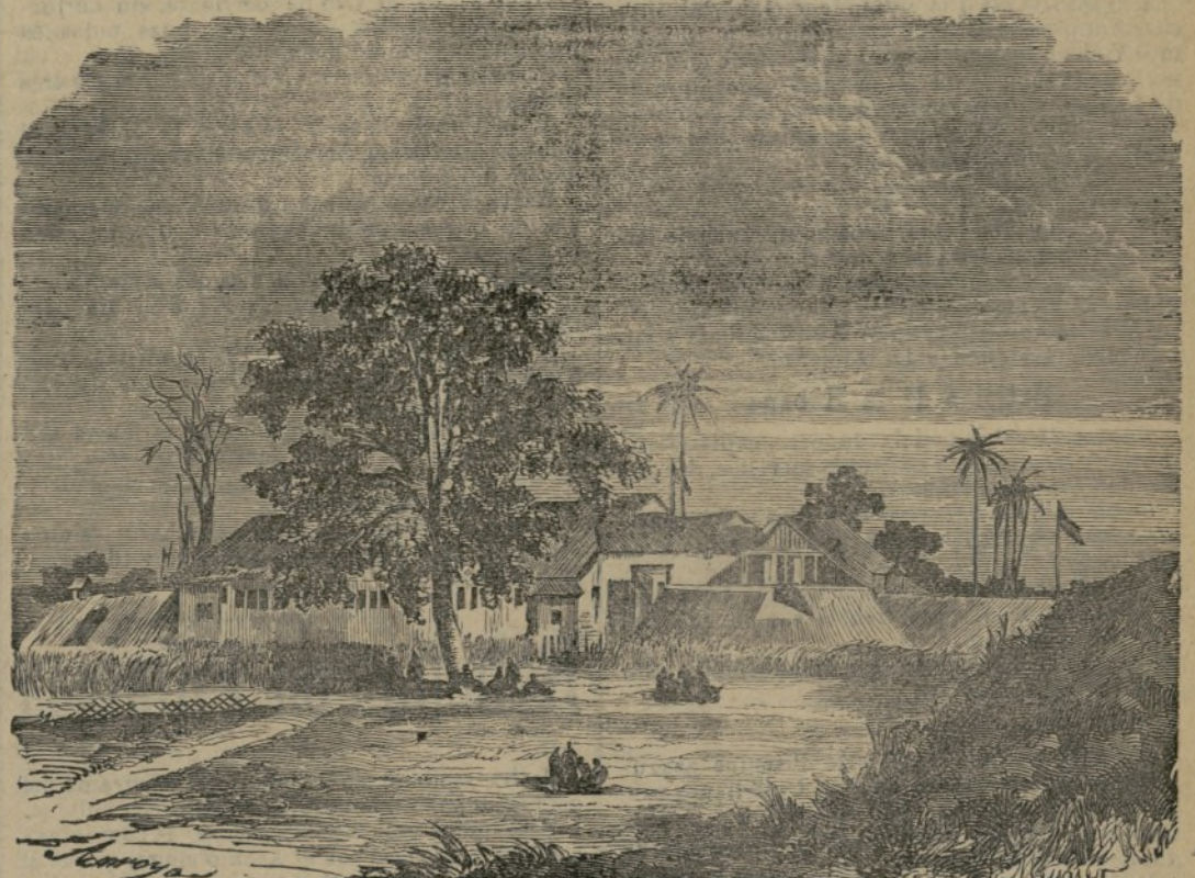
PAISAJE DE FERNANDO PÓO

París 25.—Hasta junio del año próximo no se verificará en San Quintín la inauguración del monumento conmemorativo de la defensa contra los españoles en 1557.— Fabra .