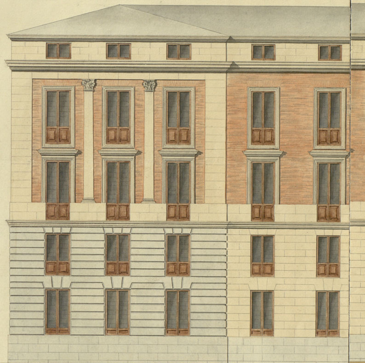
Fachada a la Calle de Felipe V.