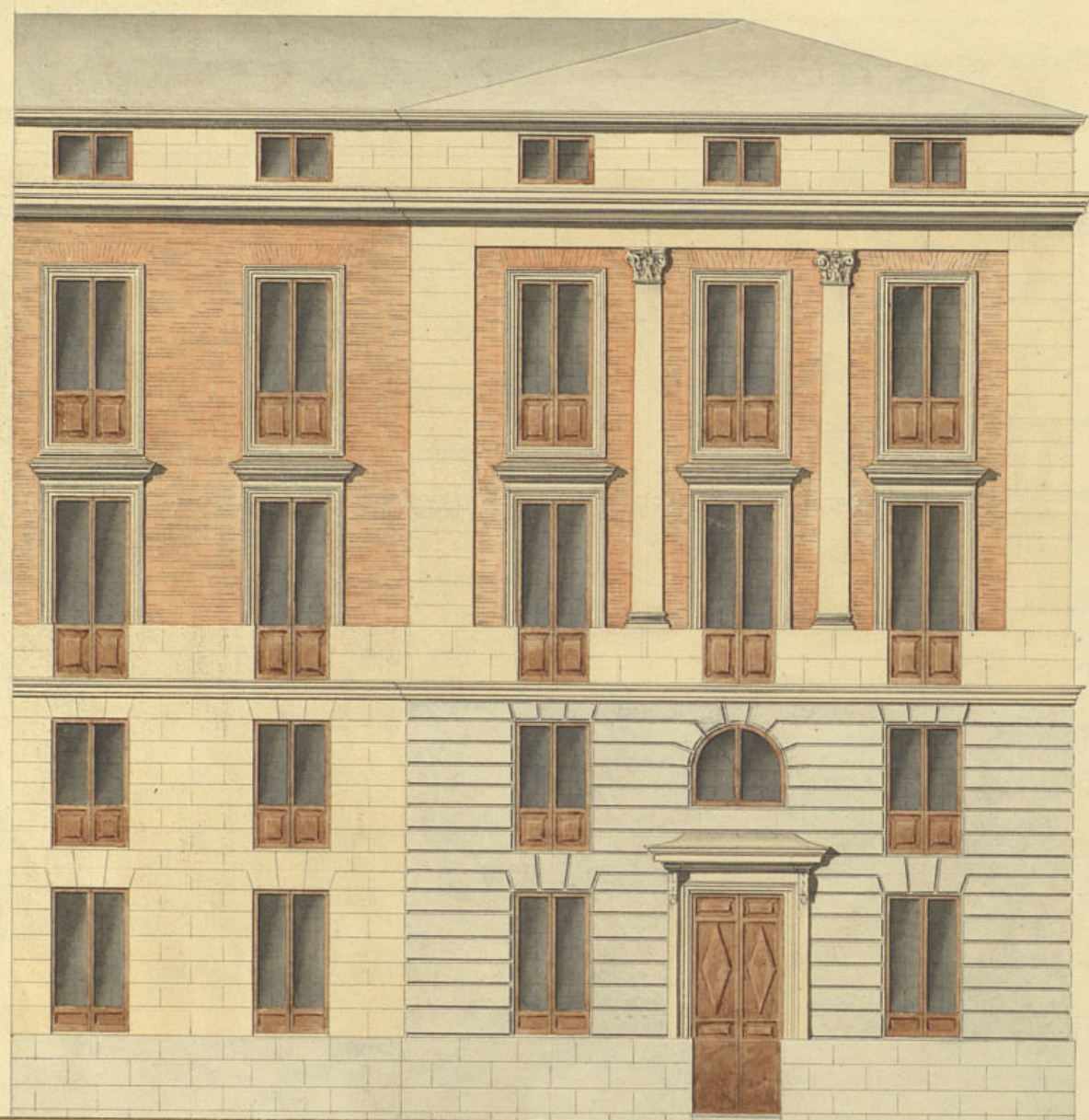
Fachada a la Plaza de Oriente.