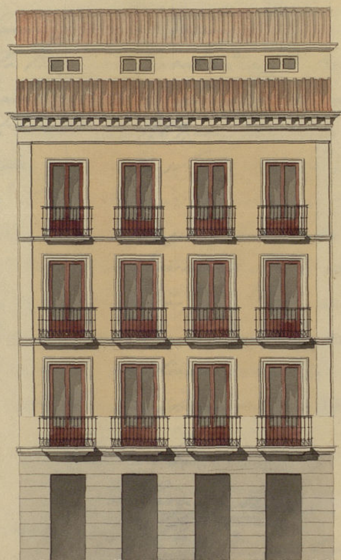
Calle de la Luna.