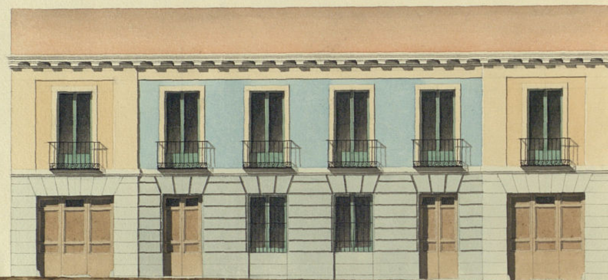
Fachada a' E.