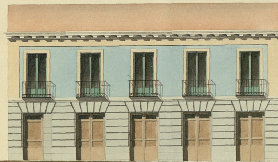
Fachada a' S.

Escala de 10. 5. 0. 10. 20. 30. 40. 50. 60. 70. 80. Pies Cast.