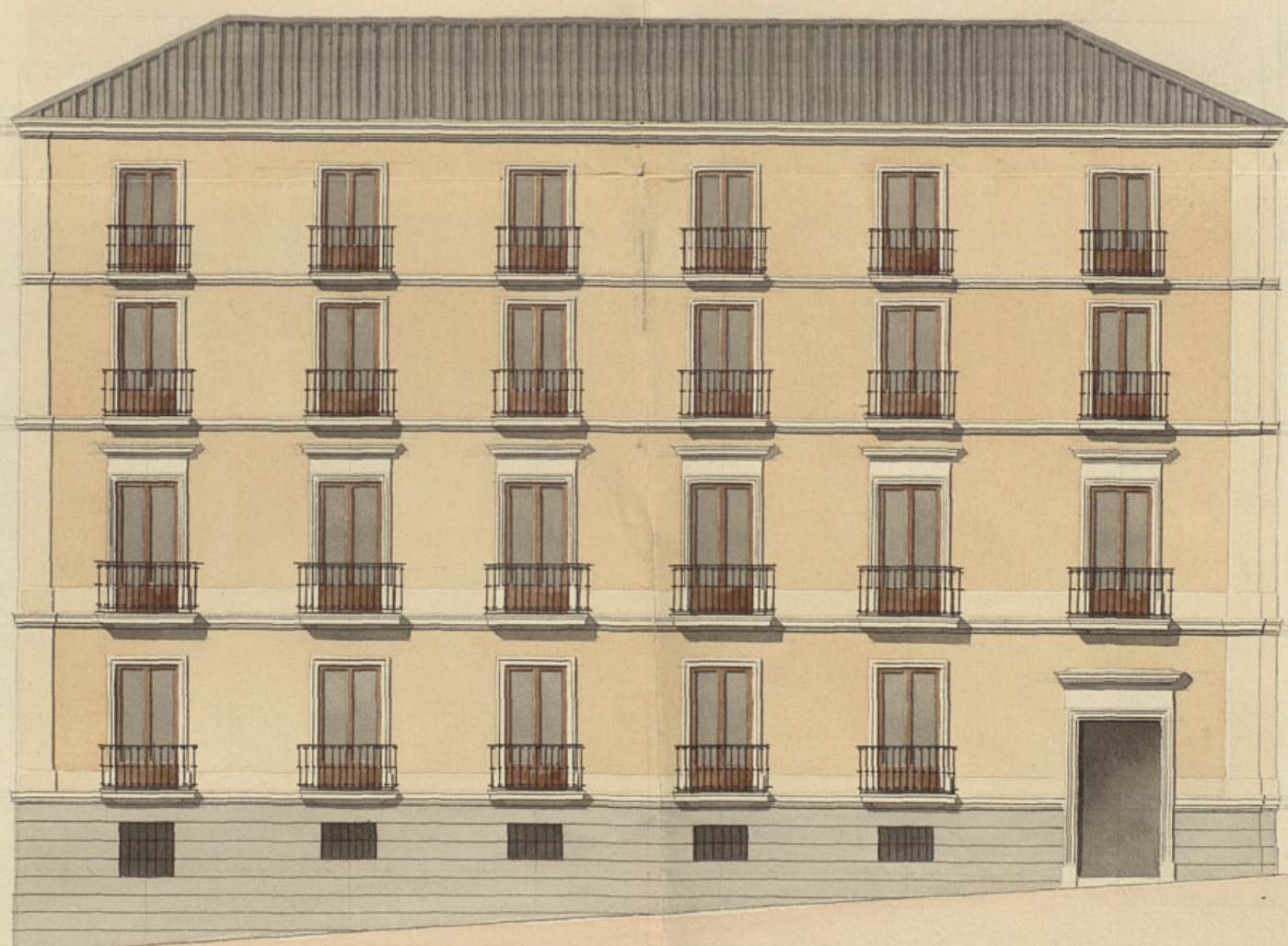
Fachada en la Calle de la Luna en la que se han de construir los dos últimos pisos.