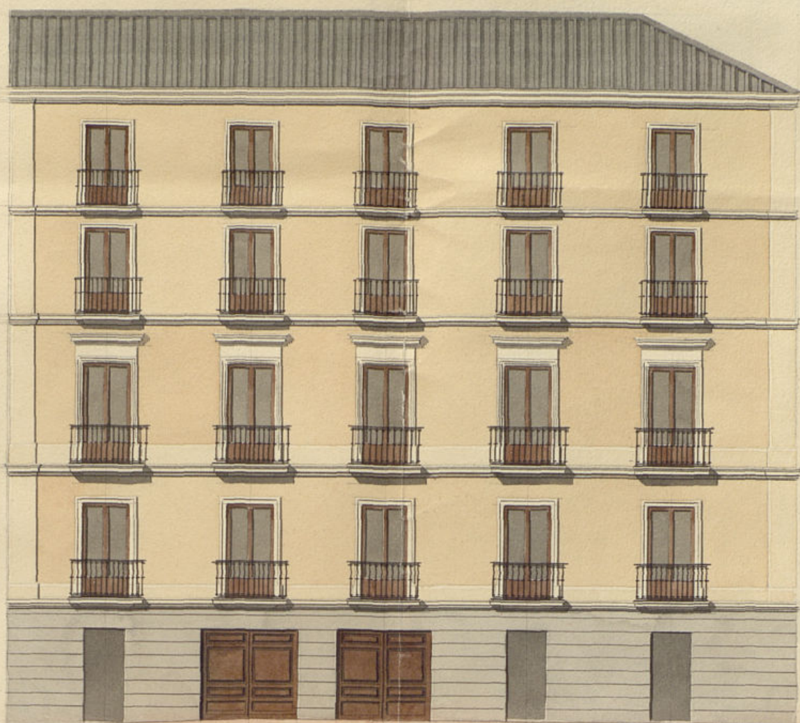
Fachada en la Calle de la Cruz verde en la que se han de construir los dos últimos pisos.

Diseño de las fachadas para la reedificación en parte de la Casa del Excmo Sr. Conde Viudo de Villariego, sita en las Calles de la Luna, de la Cruz verde, y la de Panaderos, números 40, 2 y 1 de la manzana 481.