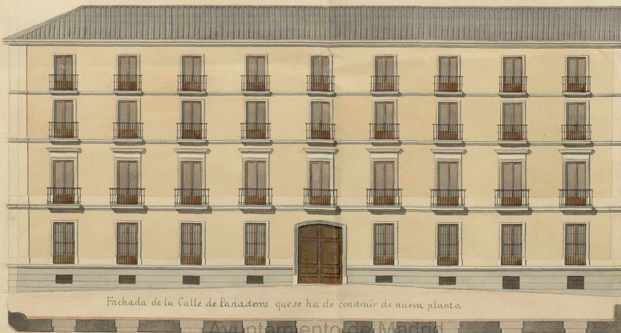
Fachada de la Calle de Panaderos que se ha de construir de nueva planta