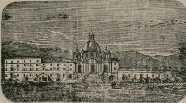
CASA DE LA COMPAÑÍA DE JESUS

El padre Rivadeneira, en su vida de San Ignacio, hace de éste el siguiente retrato: