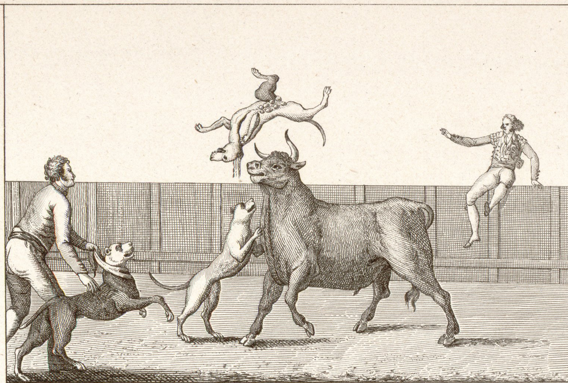
Nº 6. Los Perros embisten al Toro.