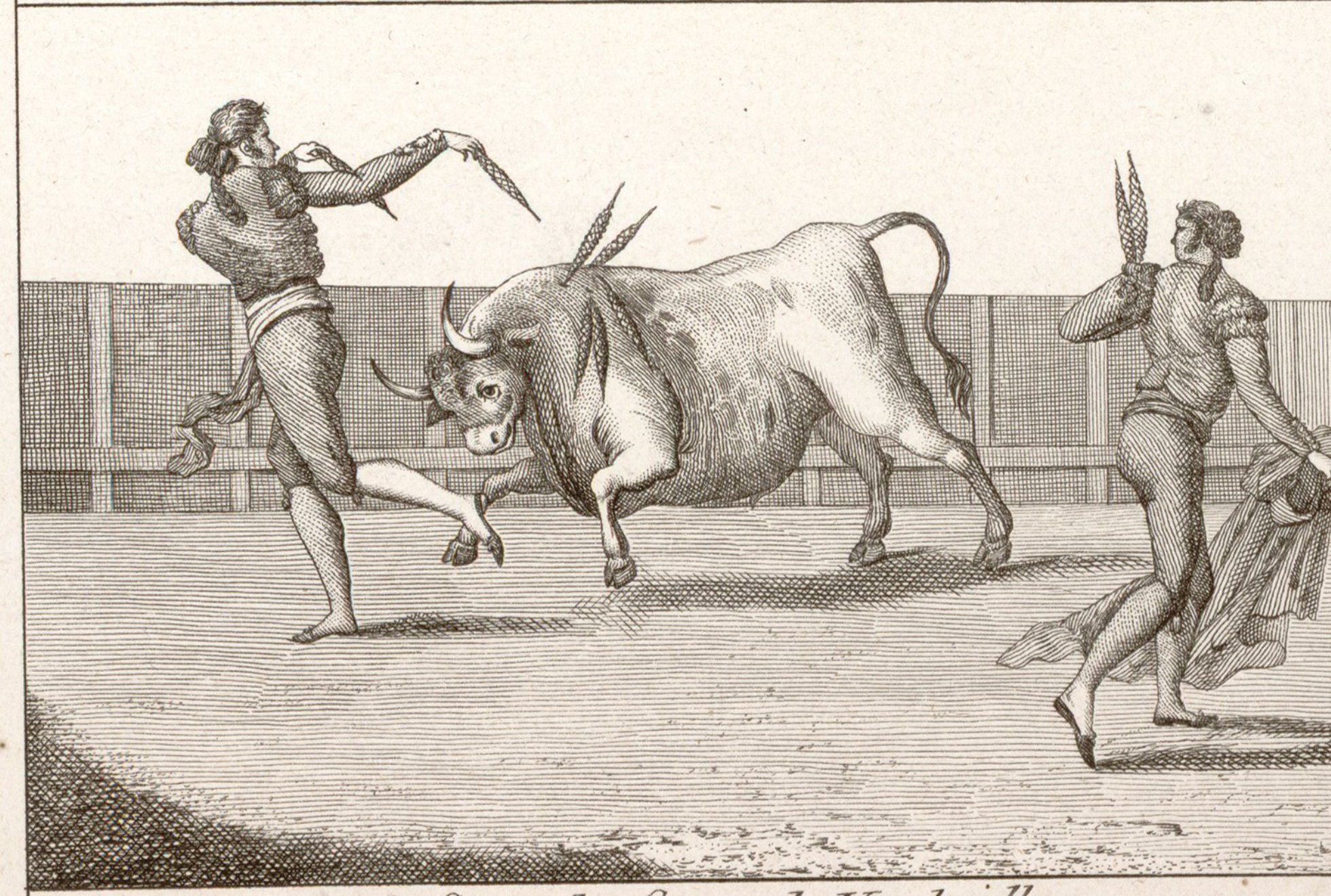
Nº 8. Segunda Suerte de Vanderillas.

Se hallará con las demás suertes en Mad. d Estamperia de la C. a de la Cruz num. os 3 y 4 esquina á la de Majaderitos ancha.