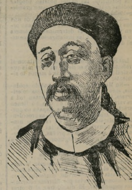
SIN-MING-CHUAN GENERAL EN JEFE DE LAS TROPAS CHINAS EN COREA

Los corresponsales de periódicos extranjeros en Asia siguen dando noticias de la guerra chino-japonesa. Dicen que la escuadra del Mikado pretende bombardear el puerto de Tako, el más próximo a Pekín.