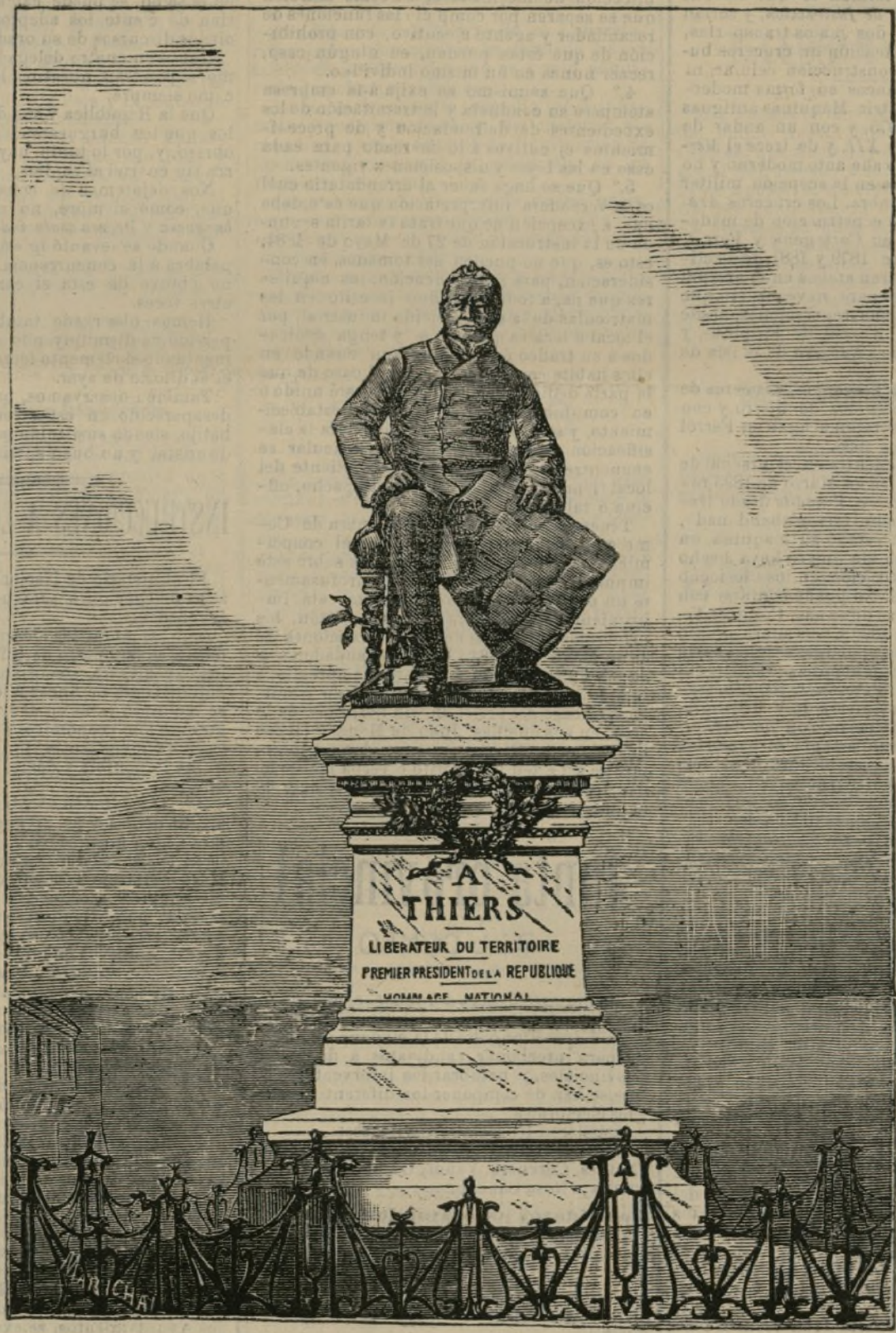
Monumento á Thiers

Una de las figuras de mayor realce en la Francia del siglo XIX ha sido el grande orador jurista y literato, M. Adolfo Thiers, que falleció en París el día 3 de Septiembre de 1877, hoy hace diecisiete años.