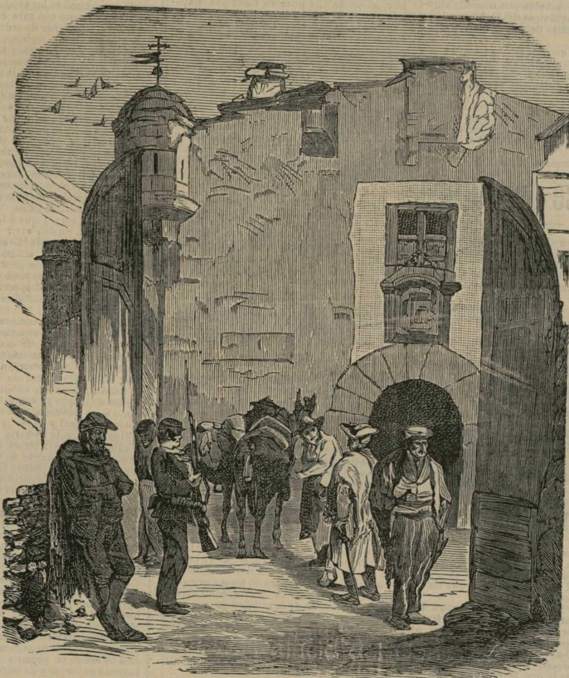
ANDORRA.—Palacio del Consejo

Y esto, en los actuales momentos, se nos figura cosa de mayor y más transcendental interés para España que todo lo relacionado con el incidente de Melilla.