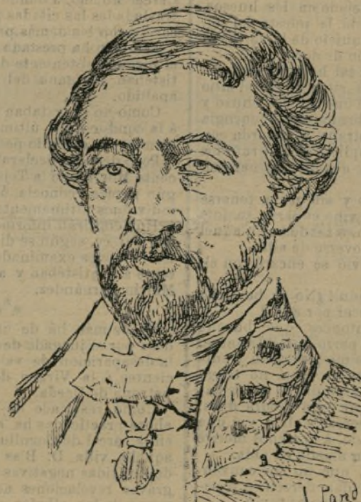
D. Nicomedes Pastor Díaz

«En 1849, cuando leyó sus brillantes lecciones, era tan enemigo de la economía política, como los peligrosos novadores que á la sazón agitaban el mundo; era tan opuesto al principio indio dualista , como los más ardientes sectarios del socialismo, á quien com-