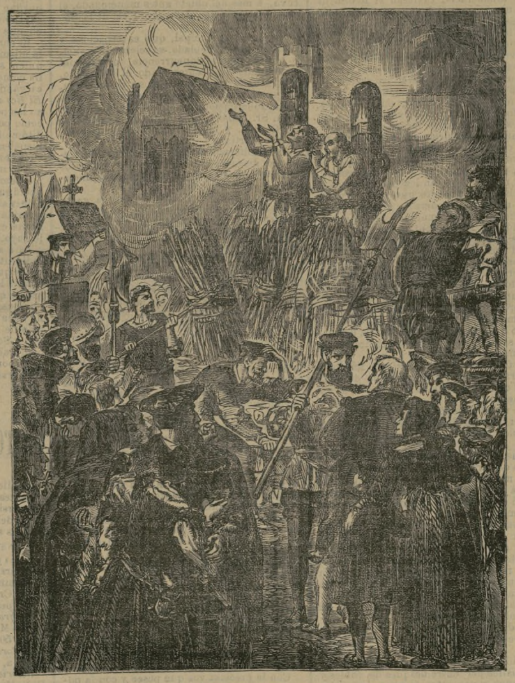
Ejecución de Latimer y Ridley (15 DE OCTUBRE DE 1555.)

ces Latimer, volviéndose a su compañero le dijo: «Consolao, Sr. Ridley; hoy encendemos en Inglaterra, por la gracia de Dios, una candela que nunca se apagará, según confío.» Así perecieron estos dos mártires del fanatismo y de la intolerancia religiosa. El tormento y la afrenta del suplicio no ha impedido el triunfo de la Reforma, lo mismo que