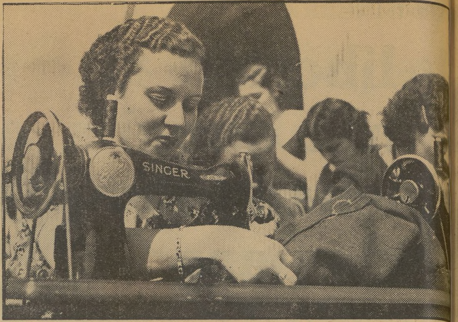
Como esta bella muchacha hay centenares en los talleres colectivos creados por Juventud Unificada de Madrid, que laboran sin descanso en el trabajo de la retaguardia

¡Heroica población! ¡Gracias a la ayuda de Dios y de San Evaristo, patrón de la villa, venceremos!”