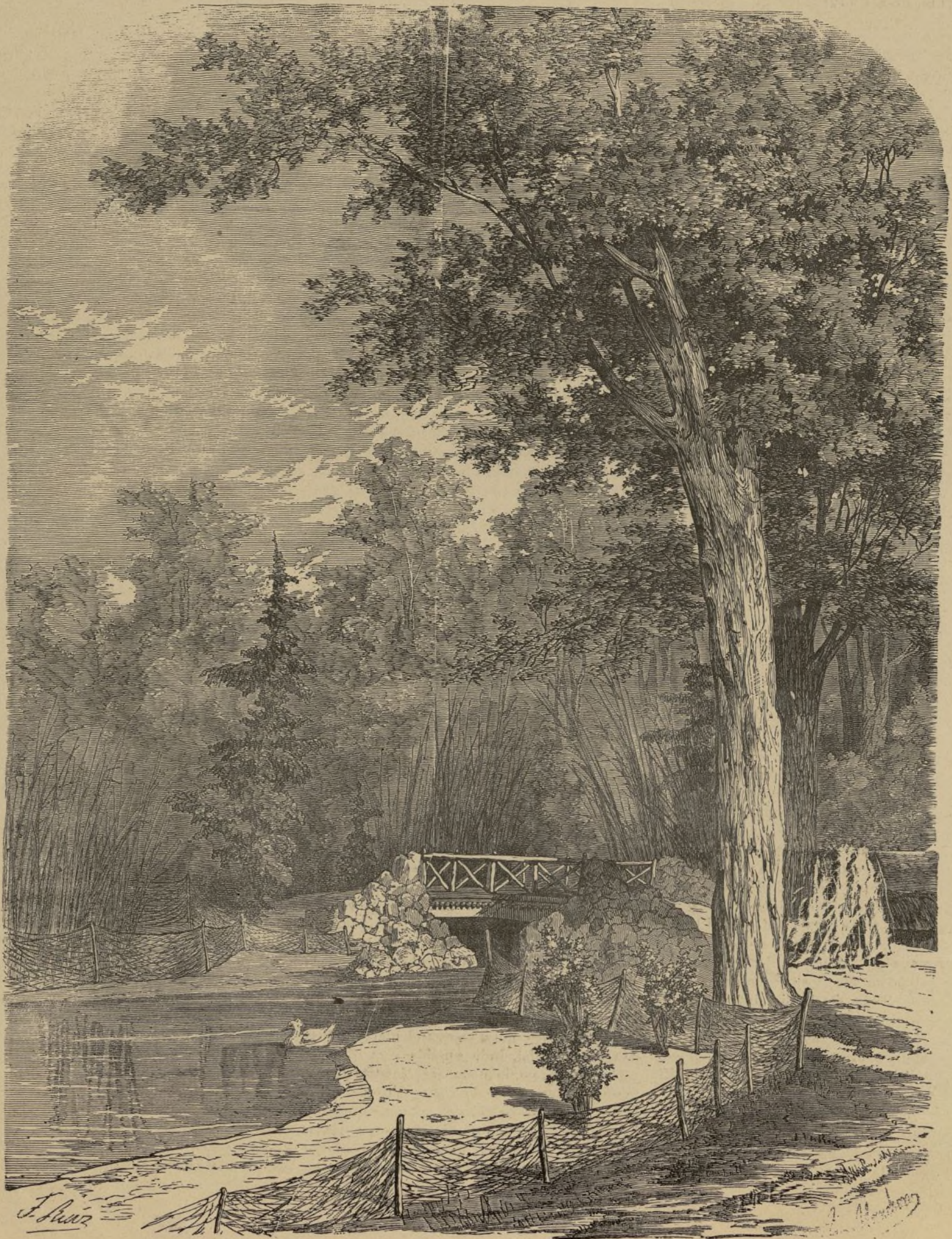
NUNCIOS DE PRIMAVERA

Para dar idea de la laboriosidad é ilustración de la finada bastará solo con apuntar las principales obras que publicó, mereciendo todas ellas una entusiasta acogida; entre dicha obras re-