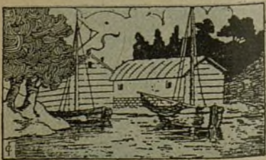
Buscar el pescador